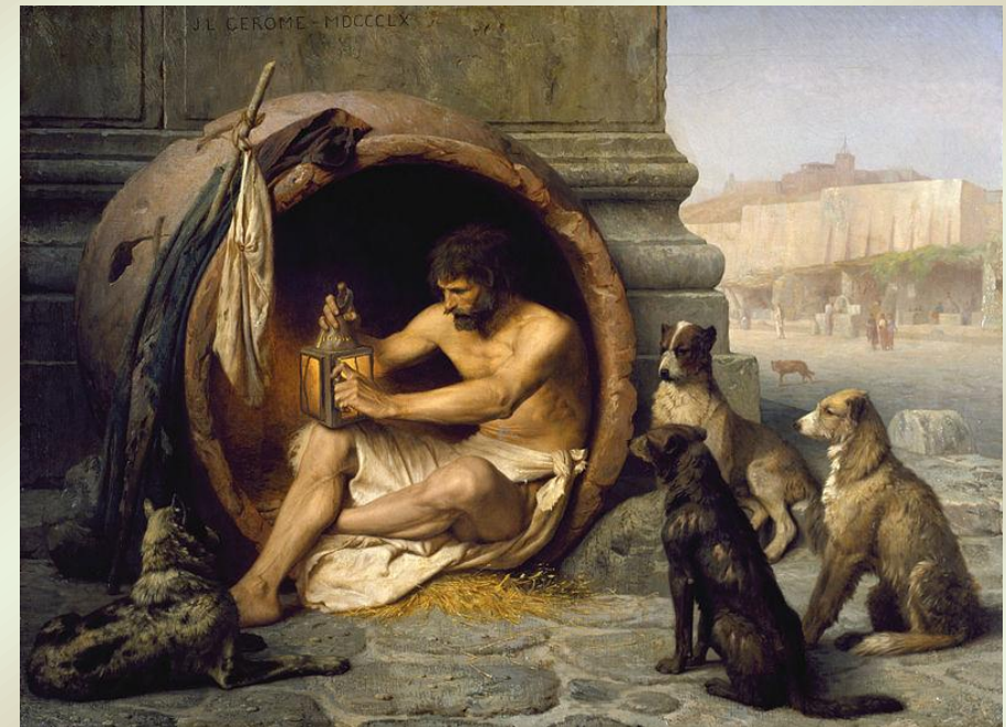
Diogène par Jean-Léon Gérôme, 1860, Walters Art Museum, Baltimore.